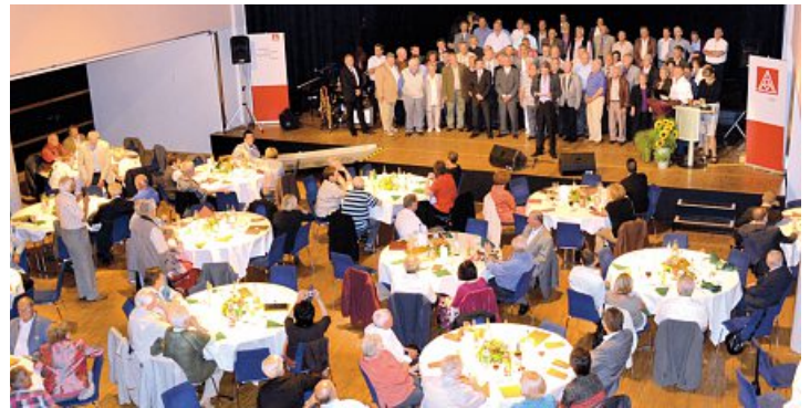
Jubilarehrung im Saal des Kulturhauses in Laupheim

Landgraf forderte, die Finanzbranche bei der Lösung der Schuldenkrise endlich konsequent in die Pflicht zu nehmen. Die Verursacher müssen zur Kasse gebeten werden.