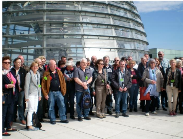
Der Seniorenarbeitskreis 2013 im Bundestag in Berlin

Kostenlose Freizeitunfallversicherung Rechtsberatung und Rechtsschutz in Renten- und Sozialangelegenheiten. Unterstützung in Notfällen Rentnerunterstützung Ehrung für Jubilare Arbeitskreis Seniorinnen und Senioren