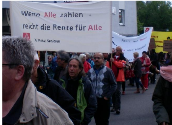
Teilnahme an der 1. Mai Demonstration 2014 in Ulm