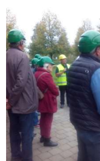
Besichtigung des Müllheizkraftwerks Ulm im Donautal im Oktober 2018